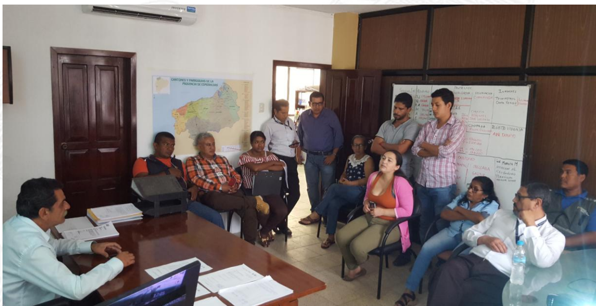
Funcionarios de la Oficina Técnica Esmeraldas, participando de la socialización de la Rendición de Cuentas 2018